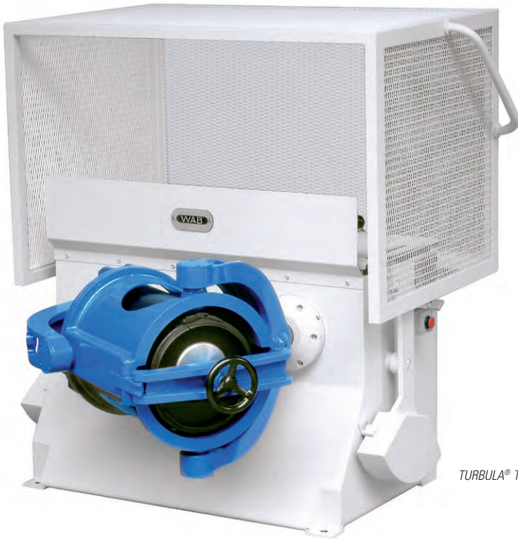
TURBULA® T 50 A