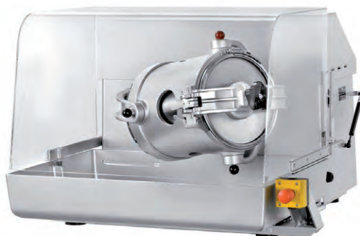
TURBULA® T10B in Sonderlackierung TURBULA® T10B with special coating TURBULA® T10B avec peinture spéciale