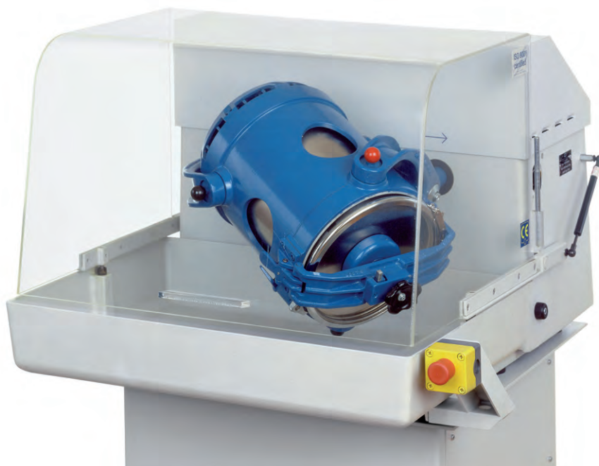
TURBULA® T 10 B