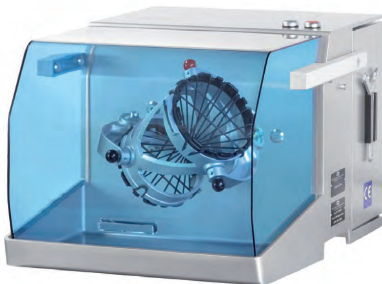
TURBULA® T2F mit FU, in Sonderlackierung TURBULA® T2F with FC, with special coating TURBULA® T2F avec CF, avec peinture spéciale

Le mélangeur TURBULA® T 2 F est utilisé dans toutes les industries et domaines, particulièrement en recherche, développement et analyse.